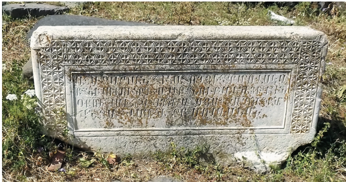
Նկ. 4. Մելիք - Նուբարյանցի տապանաքարը