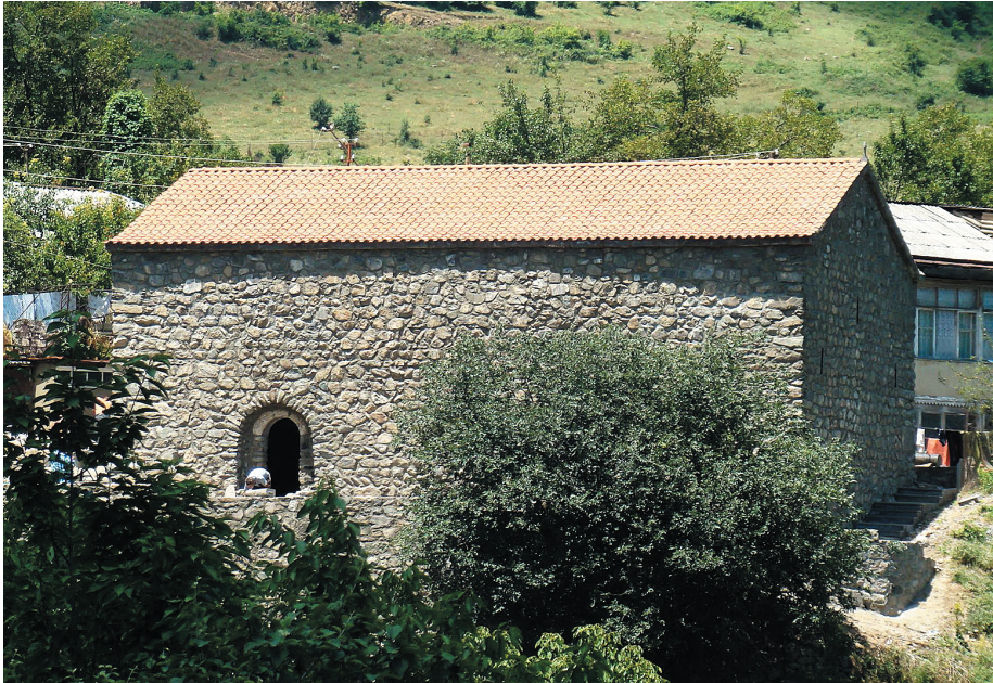
Նկ. 1. Ս. Ստեփանոս Նախավկա եկեղեցու ընդհանուր տեսքը

Շիկահողի Ս. Ստեփանոս Նախավկա եկեղեցու պեղումների արդյունքները