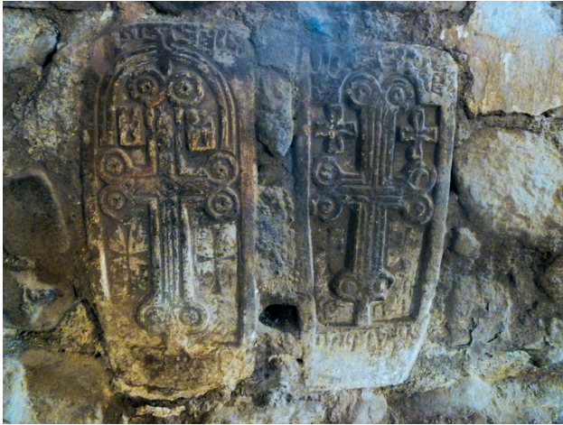
Նկ. 3. Բենուտէջին ագուցված զոյգ խաչքարերը